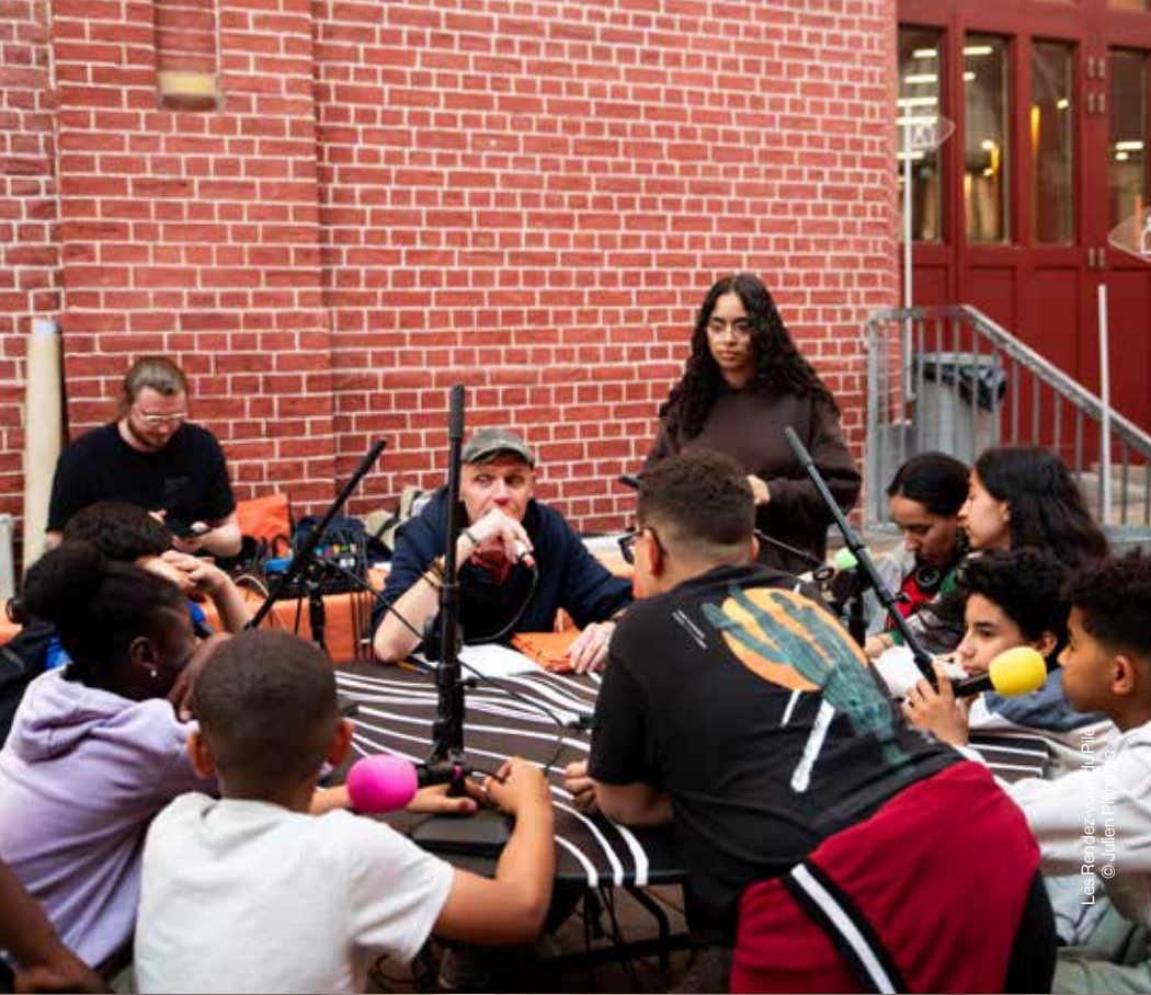
Les Rendez-vous du PRO