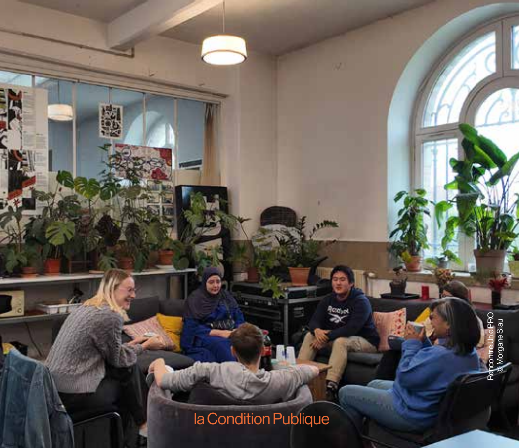
Rencontre Un.e PRO