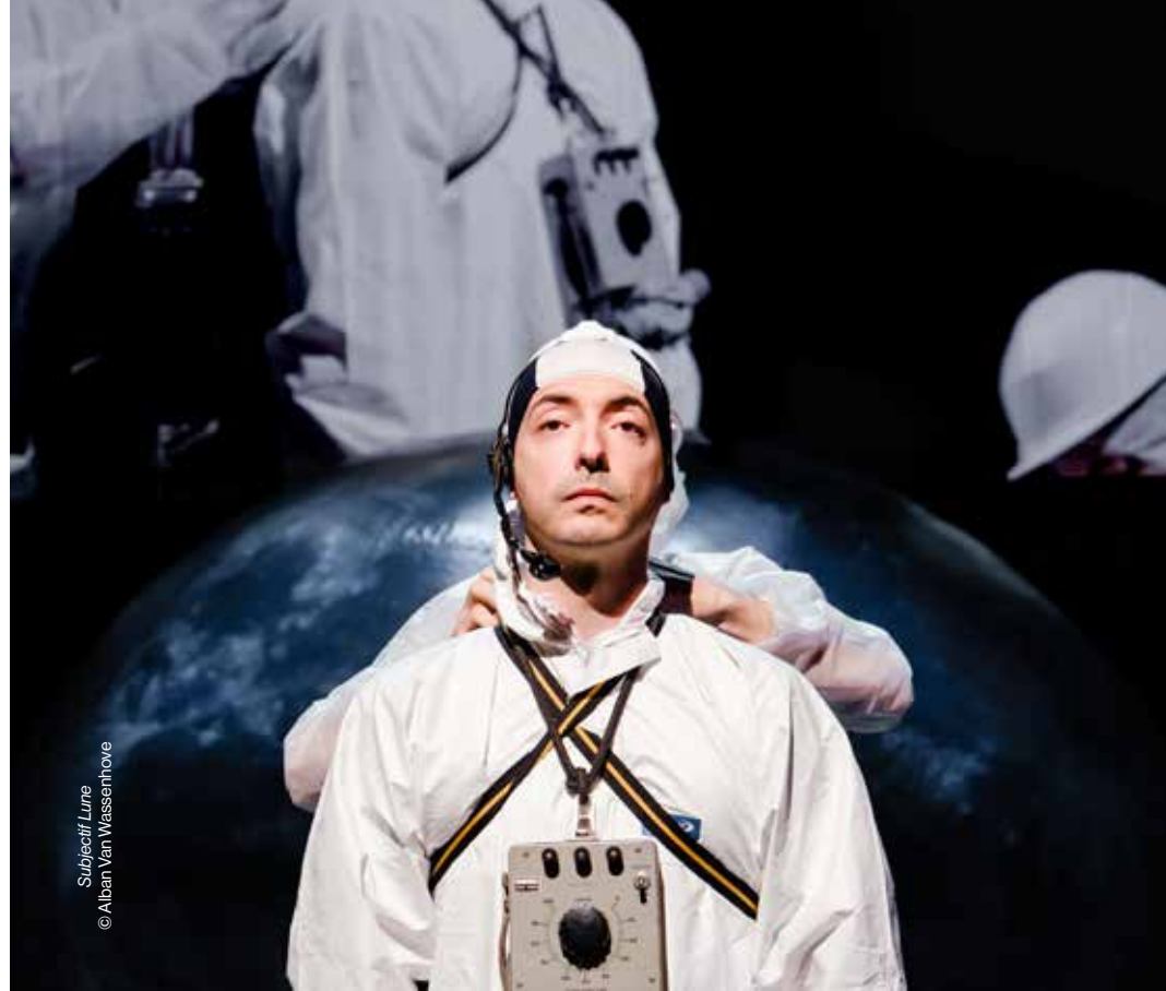
Subjectif Lune © Alban Van Wassenhove

En partenariat avec Lille3000 Et la Biennale Là-Haut