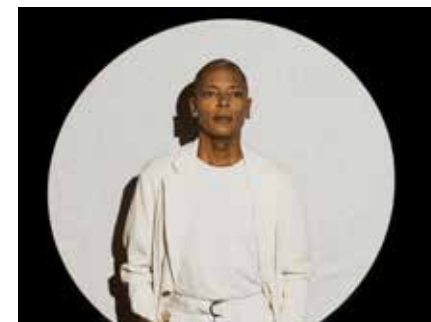
Jeff Mills

En partenariat avec la Cave aux Poètes dans le cadre du festival We Loft Music #5