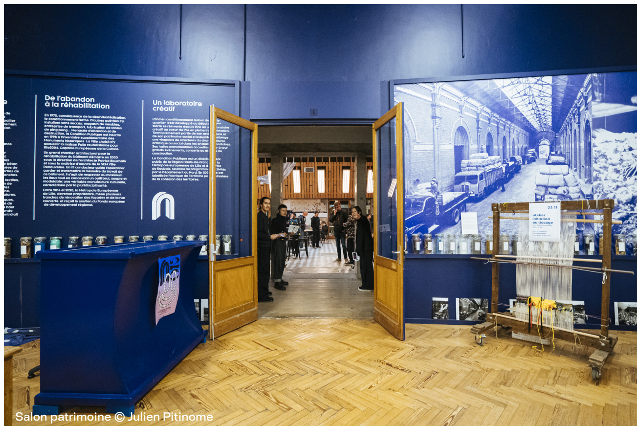
Salon patrimoine