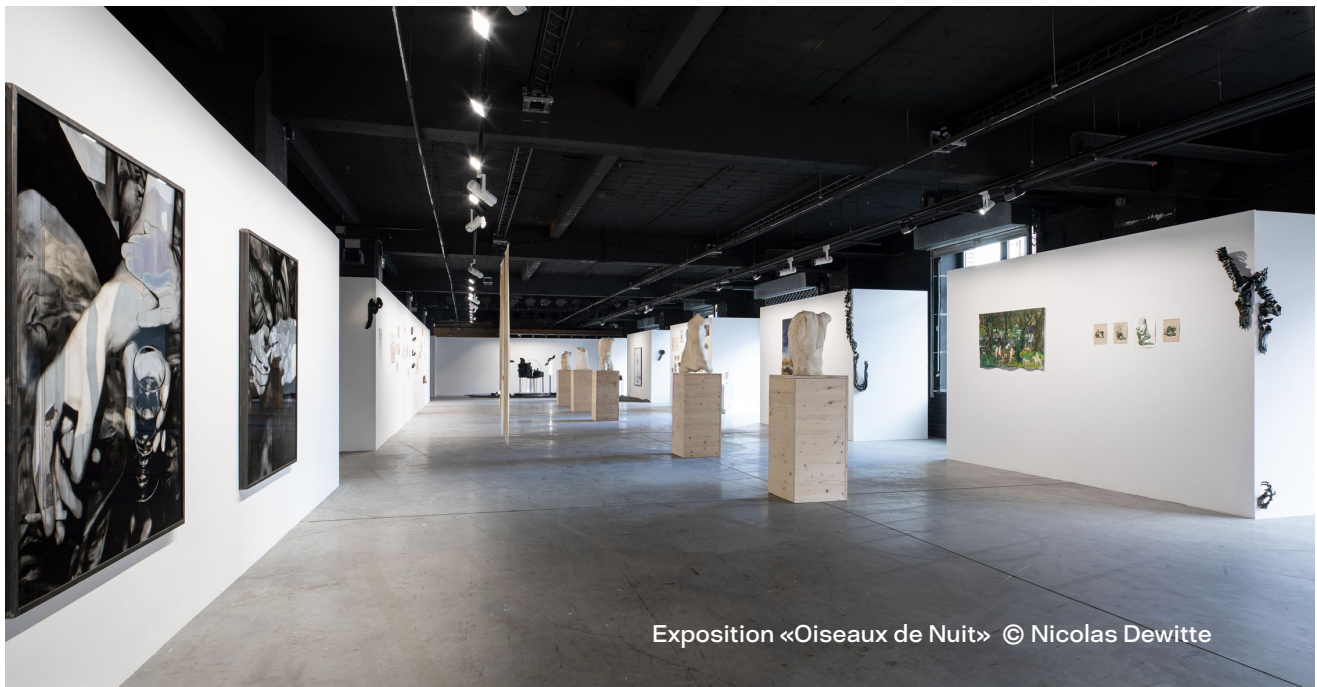
Exposition «Oiseaux de Nuit» © Nicolas Dewitte