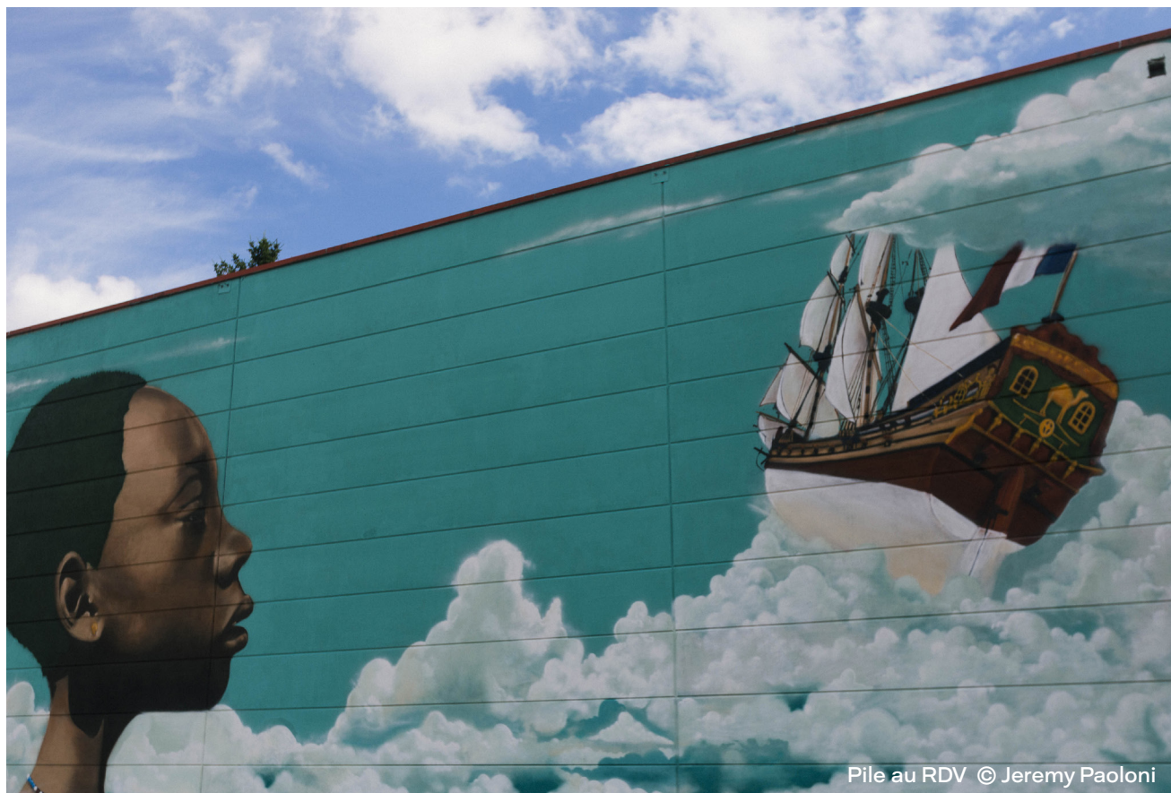
Pile au RDV

Depuis 2017 la Condition Publique invite des artistes à expérimenter de nouvelles démarches, accueilli.es en résidence pour des projets in situ et hors les murs, des oeuvres hybridant les pratiques et investissant les champs de l'urbanisme et de l'innovation sociale forment aujourd'hui un musée à ciel ouvert. Explorez le temps d'une visite guidée adaptée à votre groupe les nouvelles formes de l'art urbain en dialogue avec le patrimoine roubaisien.