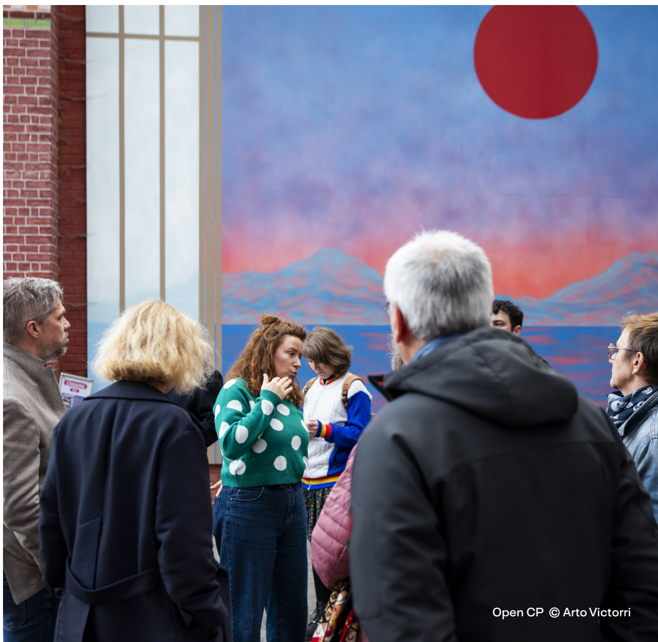
Open CP