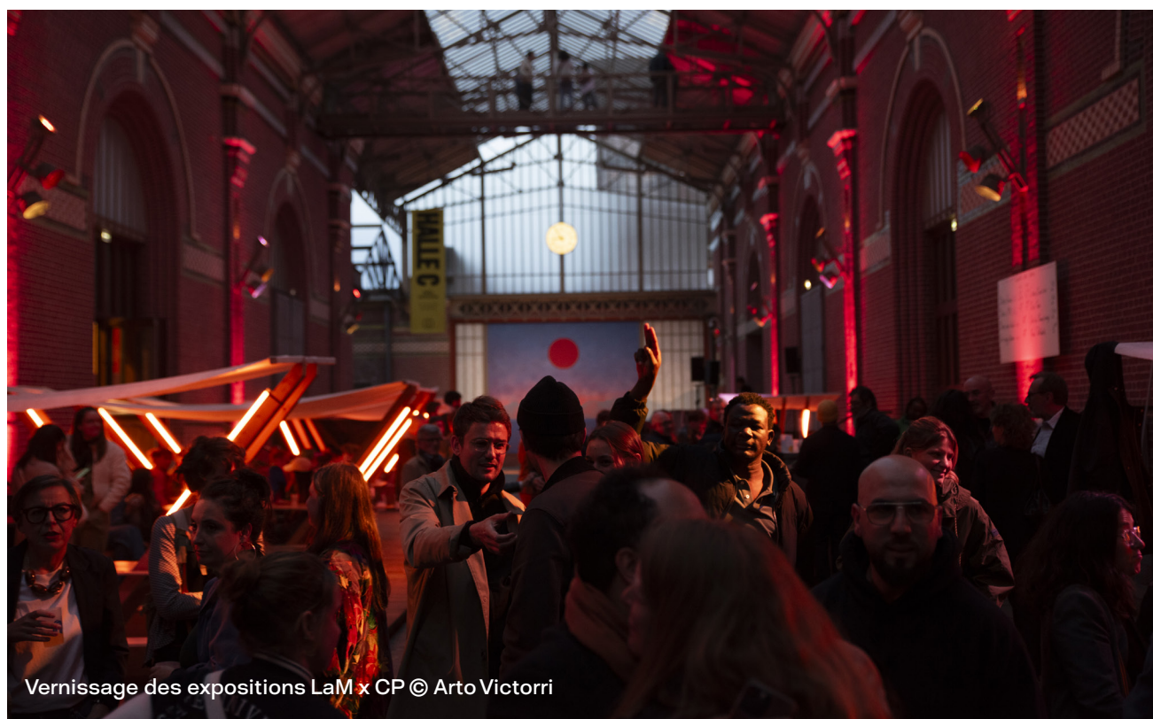
Vernissage des expositions LaM x CP