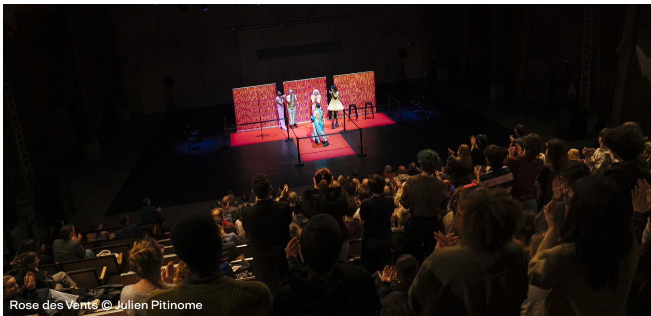
Rose des Vents