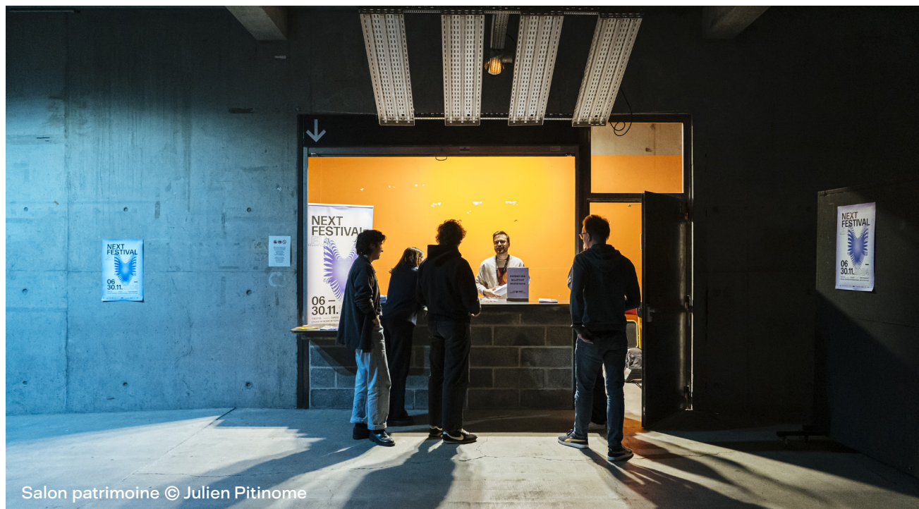
Salon patrimoine